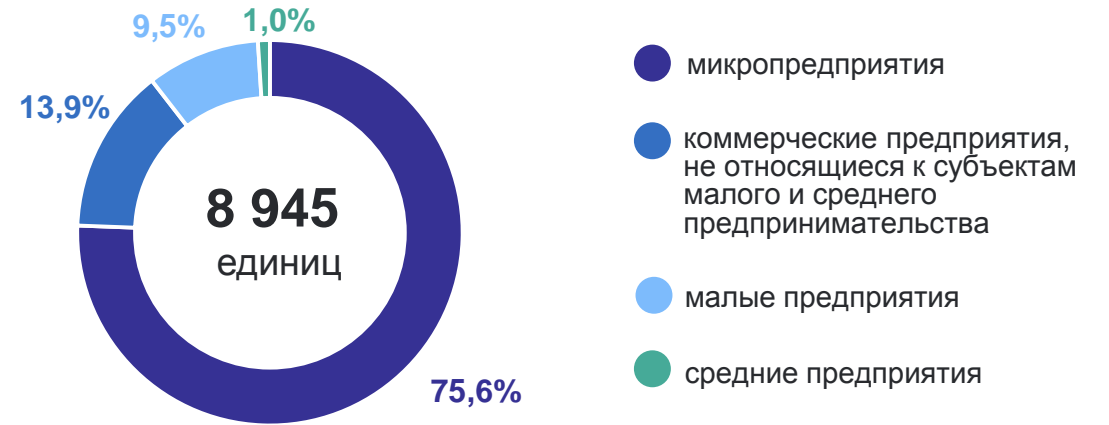
Коммерческие организации на 1 января 2024 года